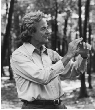
Abb. 2 Richard Feynman im Jahr 1984

Leistungen, um die es in diesem Buch immer wieder gehen wird. Feynman gehörte zur ersten Generation junger Physiker, die bereits im Studium mit den Erkenntnissen der noch jungen Quantenmechanik vertraut gemacht wurden. So vorbereitet gelang es ihm und einigen seiner Kollegen später, die enormen Schwierigkeiten zu überwinden, die sich bei der Vereinigung von Einsteins Spezieller Relativitätstheorie mit den Prinzipien der Quantenmechanik auftraten. Während sich seine Kollegen dabei meist auf abstrakte mathematische Formalismen verließen, vertraute Feynman auf einen eher intuitiven Ansatz, der typisch für ihn war. Ausgehend von seiner anschaulichen Vorstellung über das Quantenverhalten von Teilchen erschuf er eine vollkommen neue Formulierung der Quantentheorie, die heute zum Standardwerkzeug in der relativistischen Quantentheorie geworden ist: Pfadintegrale und Feynman-Diagramme. Für diese Leistung erhielt er im Jahr 1965 zusammen mit Julian Schwinger und Shin'ichirō Tomonaga den Physik-Nobelpreis.