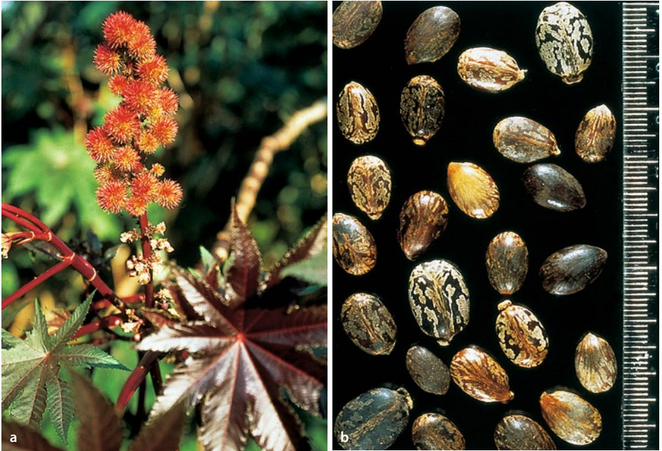
■ Abb. 10.5a,b Ricinus (Wunderbaum), a Blütenstand, b Samen

Blütenhülle. Die männlichen Blüten, die viele Staubblätter haben, befinden sich im unteren, die weiblichen im oberen Teil des traubigen Blütenstandes. Die Frucht ist eine 3-fährige Kapsel mit 3 bunten, zeckenähnlichen Teilfrüchten. Blütezeit: Juli–August.