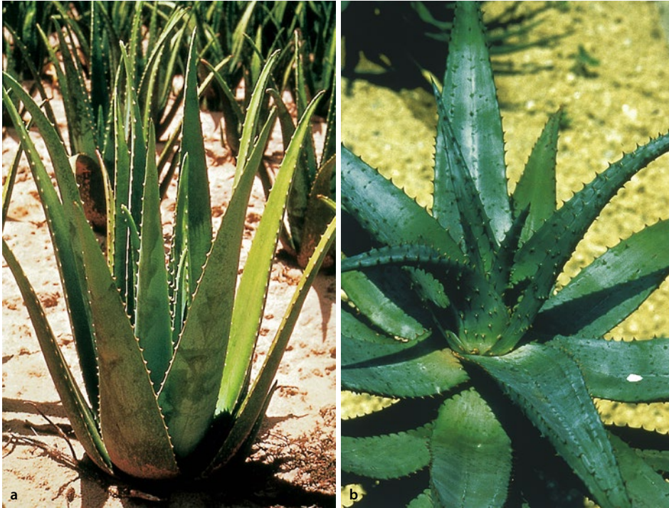
▣ Abb. 10.1 a Aloe vera, b Aloe ferox

Beere. Aloe ferox ist eine mehrjährige Pflanze mit vielen endständigen Blattrosetten aus großen, fleischigen, hellblaugrünen, dunkelgrünen oder rötlichen, lanzettlichen Blättern mit einigen kurzen, stacheligen Zähnen. Die etwa 3 cm langen Blüten sind gelb mit grünlichem Rand, tief 6-lappig. Der Stamm ist von etwa 10 cm Dicke und wird bis zu 6 m hoch.