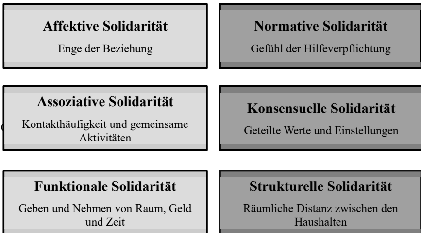
Abbildung 2.1: Dimensionen intergenerationaler Solidarität