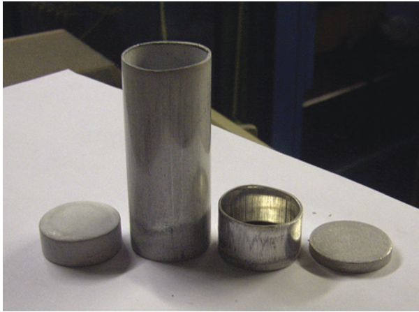
Abb. 2.2 Versuchsproben. (Eigene Darstellung)

Meistens wird kalt umgeformt, d. h. es findet unter der Rekristallisierungstemperatur statt. Im Gegensatz zum Warmumformen, wo sich demzufolge eine andere Struktur aufbaut, findet eine höhere Kaltverfestigung an der Oberfläche statt.