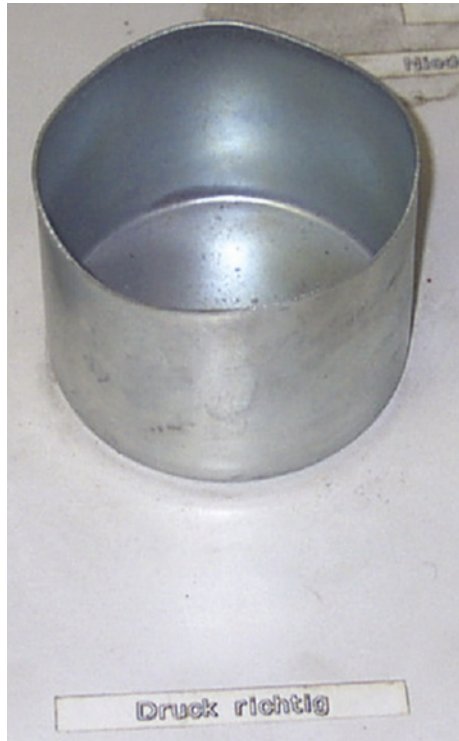
Abb. 2.5 Versuchsprobe – mit richtig eingestelltem Druck hergestellt.

dem Grundwerkstoff fest verwachsene Schmiermittelträgerschicht auf den Rohling aufgebracht.