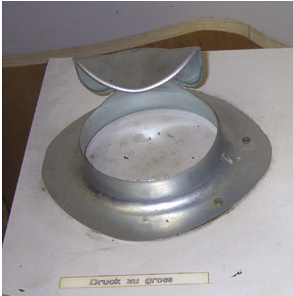
Abb. 2.4 Versuchsprobe – mit zu hohem Druck hergestellt. Anmerkung: Die Fehlstelle ist hier der durchgerissene Boden.