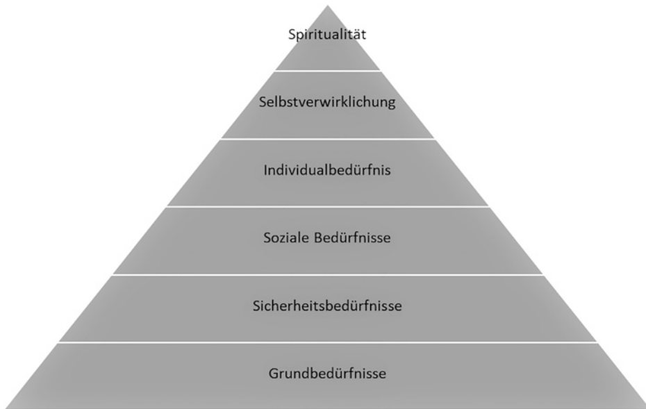
Abb. 2.2 Bedürfnispyramide nach Abraham Maslow

ähnlich destruktive Folgen hat wie Überforderung. Arbeitsleistung und Arbeitszufriedenheit stehen in einer direkten Verbindung. Folglich ist bei der Auswahl zu berücksichtigen, ob die zu besetzende Stelle inhaltlich eine Herausforderung ist. Daher zahlt es sich spätestens mittelfristig aus, dem Kandidaten den Vorzug zu geben, für den die Stelle eine inhaltliche Weiterentwicklung darstellt. Der Kandidat, für den die Stelle inhaltlich keine neue Herausforderung darstellt, ist zwar kurzfristig betrachtet das geringere Risiko für das Unternehmen, wird jedoch relativ schnell zu einem Problem. Insofern bedingt eine effektive Personalauswahl die Abwägung zwischen der möglichst genauen Passung auf die Anforderungen der Stelle und dem Delta zwischen der bisherigen Stelle des Bewerbers und der neuen Stelle. Als Faustregel sollte man sich fragen, ob die neue Position für die nächsten 5 Jahre für den Bewerber interessant sein kann. Hierbei ist natürlich auch zu berücksichtigen, ob die Stelle selber sich durch Veränderungen des Unternehmens verändern muss oder durch Job-Enrichment (höhere inhaltliche Anforderungen) oder Job-Enlargement (erweiterter Verantwortungsbereich) verändert werden kann, um der gesteigerten Leistungsfähigkeit des Mitarbeiters gerecht zu werden (vgl. Abb. 2.2).