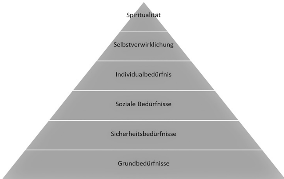
Abb. 2.2 Bedürfnispyramide nach Abraham Maslow

ähnlich destruktive Folgen hat wie Überforderung. Arbeitsleistung und Arbeitszufriedenheit stehen in einer direkten Verbindung. Folglich ist bei der Auswahl zu berücksichtigen, ob die zu besetzende Stelle inhaltlich eine Herausforderung ist. Daher zahlt es sich spätestens mittelfristig aus, dem Kandidaten den Vorzug zu geben, für den die Stelle eine inhaltliche Weiterentwicklung darstellt. Der Kandidat, für den die Stelle inhaltlich keine neue Herausforderung darstellt, ist zwar kurzfristig betrachtet das geringere Risiko für das Unternehmen, wird jedoch relativ schnell zu einem Problem. Insofern bedingt eine effektive Personalauswahl die Abwägung zwischen der möglichst genauen Passung auf die Anforderungen der Stelle und dem Delta zwischen der bisherigen Stelle des Bewerbers und der neuen Stelle. Als Faustregel sollte man sich fragen, ob die neue Position für die nächsten 5 Jahre für den Bewerber interessant sein kann. Hierbei ist natürlich auch zu berücksichtigen, ob die Stelle selber sich durch Veränderungen des Unternehmens verändern muss oder durch Job-Enrichment (höhere inhaltliche Anforderungen) oder Job-Enlargement (erweiterter Verantwortungsbereich) verändert werden kann, um der gesteigerten Leistungsfähigkeit des Mitarbeiters gerecht zu werden (vgl. Abb. 2.2).