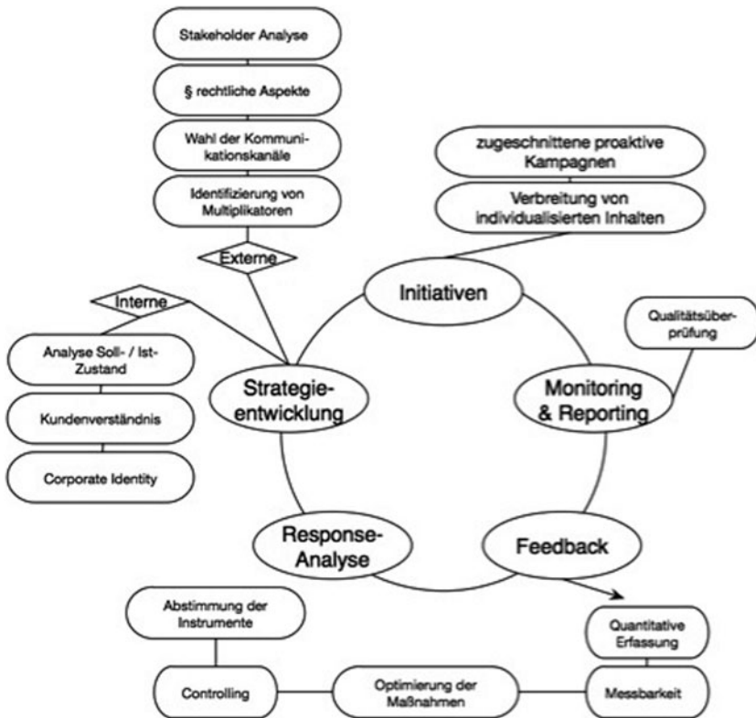
Abb. 1.2 Prozess des Reputationsmanagements.