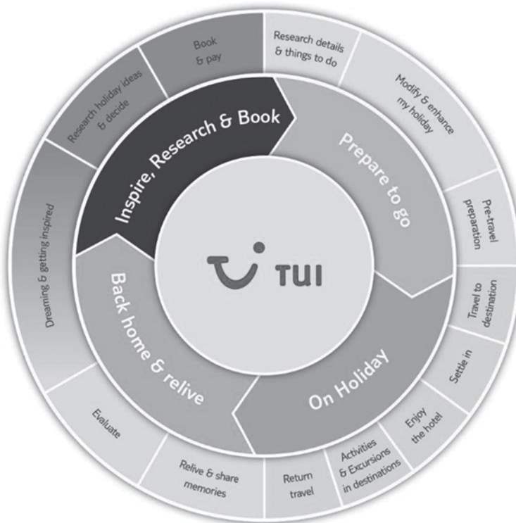
Abb. 2.2 Customer Decision Chain zur Illustration der Erlebniskette aus Sicht des Kunden.

relevanten Daten vorliegen, die der Kundenbetreuer braucht, um mit dem Kunden schnell ins Gespräch zu kommen.