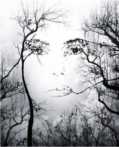
Abb. 2.1: The Tree Face 1

Schauen wir das Phänomen „Komplexität“ genauer an: