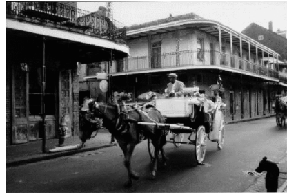
b Textentfernung mit Fast Image Inpainting; Laufzeit 1 s