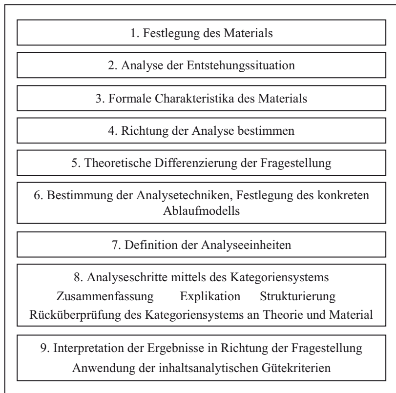
Abbildung 1: Arbeitsschritte der Inhaltsanalyse (nach Mayring 2007)

Kappa-Koeffizienten findet sich in dem zitierten Artikel von Grouven und Mitarbeitern (2007).